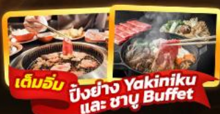
เต็มอิ่ม ปิ้งย่าง Yakiniku และ ชาบู Buffet