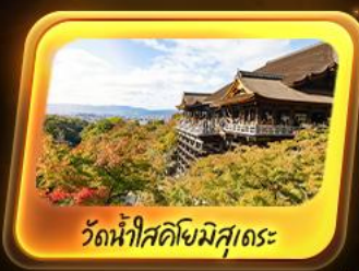
วัดน้ำใสคิโงมิสุเดระ